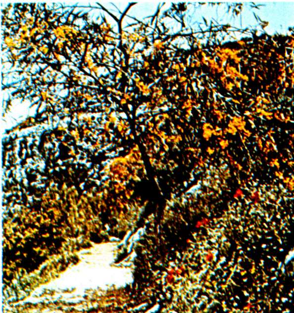
加里肋亞省的山路。